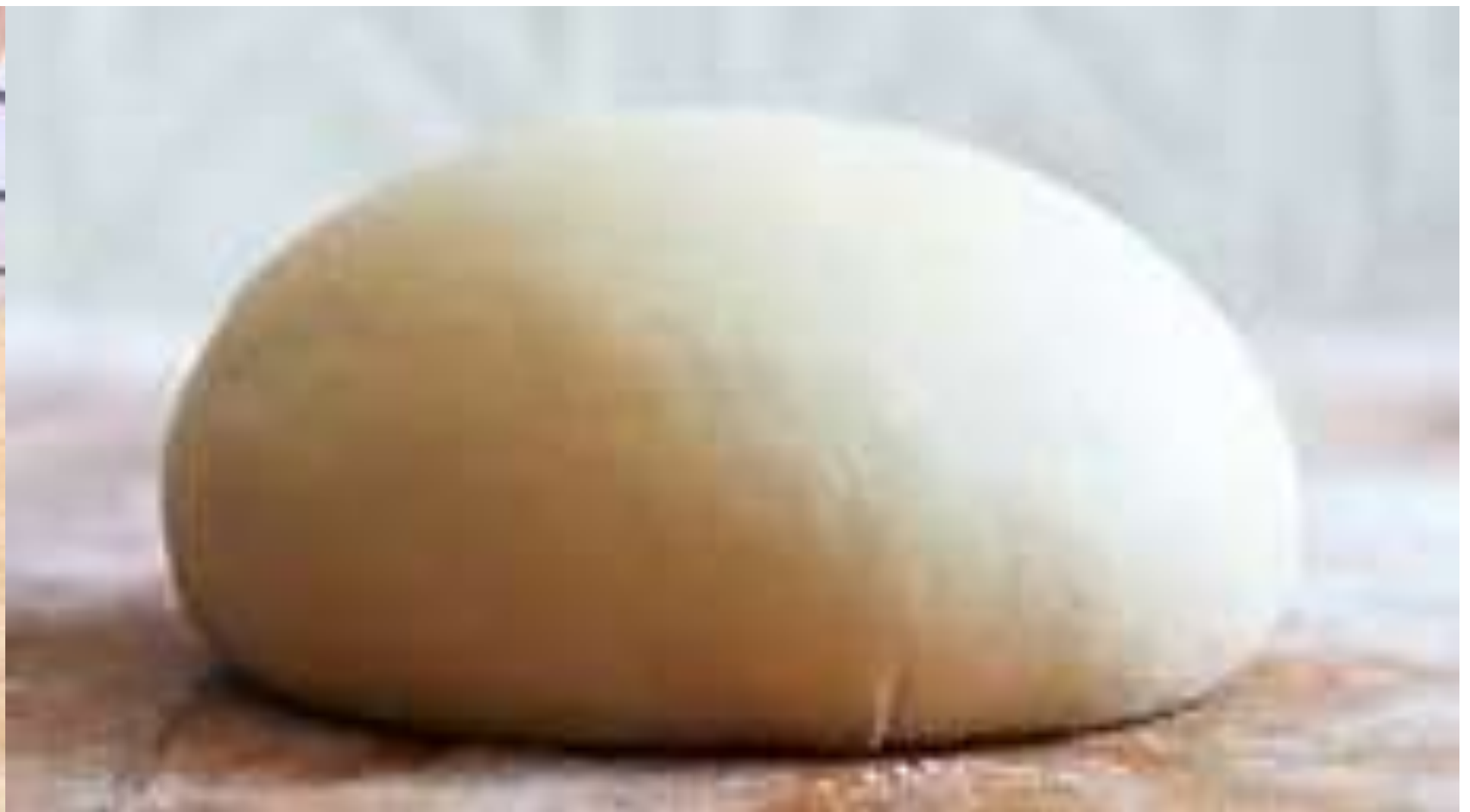
放在新團，發起全團