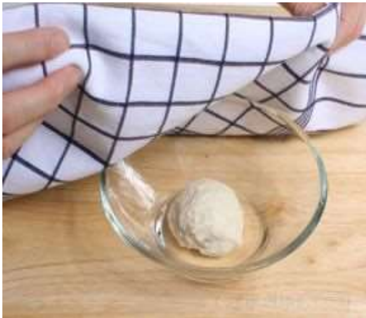
在舊團拿一小塊：麵酵

太 13:33 他又對他們講個比喻說、天國好像麵酵、有婦人拿來、藏在三斗麵裏、直等全團都發起來。