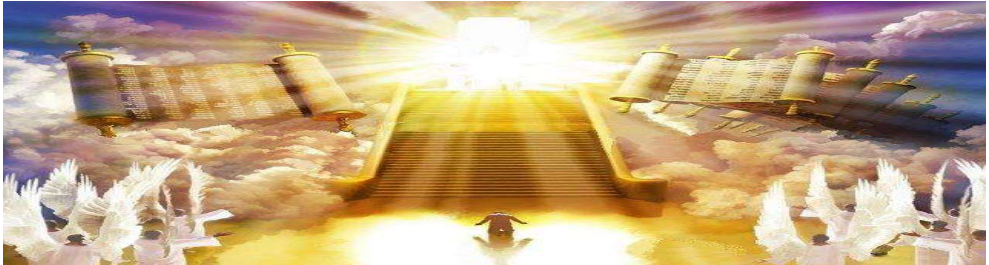
天上發生的事 (但 7:9-10, 13-14)