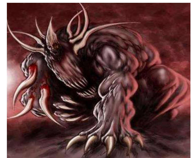
地上發生的事 (但 7:1-8, 11-12, 15-28)