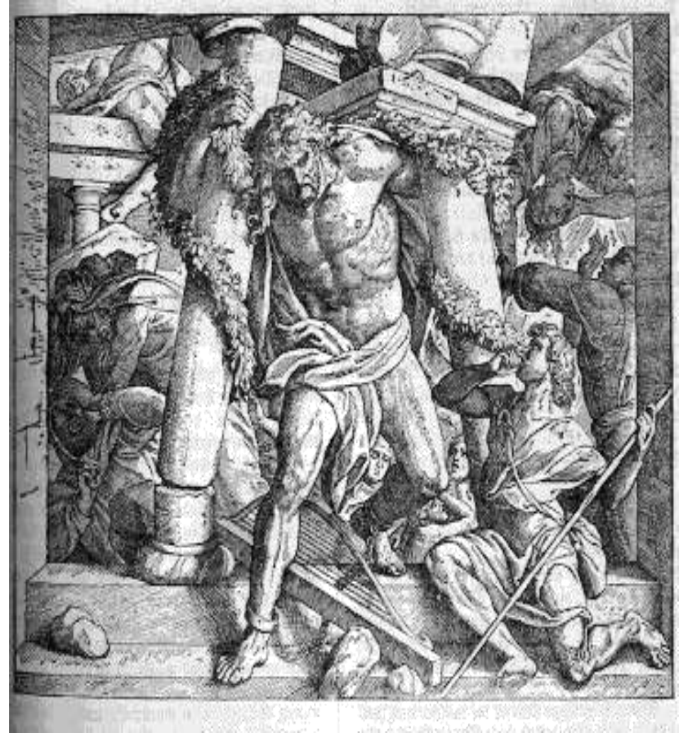
John Milton 用參孫作主 題，畫出他的悲劇。