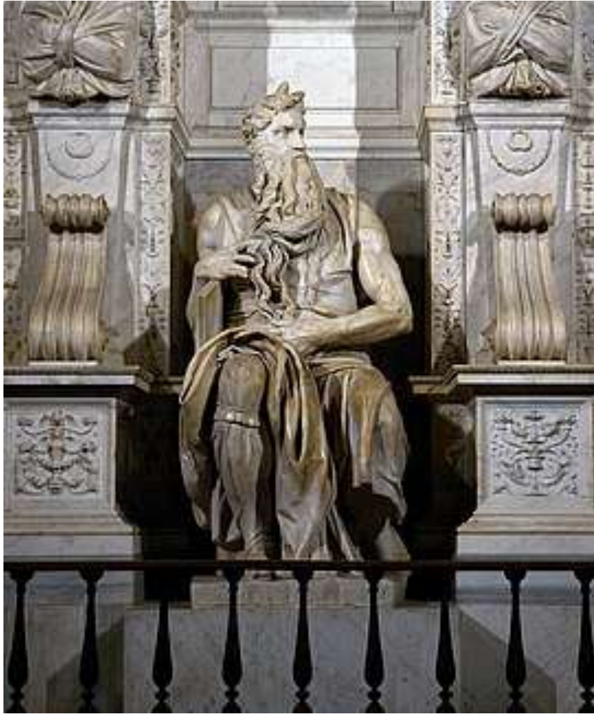
Michelangelo 雕刻 摩西，右手夾著法板， 反映出神的榮耀。